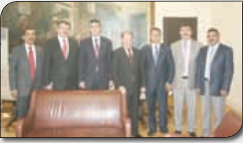
Sendikamızdan Sağlık Bakanı Prof. Dr. Recep Akdağ'a Ziyaret