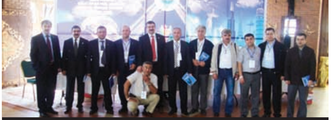
Sendikamız tarafından Görevde Yükselme Sınavı öncesinde eğitimlere katılan bütün adaylara Devlet Personel Başkanlığının hazırlamış olduğu Görevde Yükselme Ders Notları kitabı hediye edildi.

Öte yandan sendikamız 24 Temmuz 2010 tarihinde gerçekleştirilen Görevde Yükselme Sınavı'nda bazı soruların bütün unvanlar için aynı olması nedeniyle yaşanan adaletsizliğin çan eğrisi not sistemiyle çözülmesini istedi. Sendikamız tarafından Sağlık Bakanlığına gönderilen yazıda, Görevde Yükselme Sınavı'nda hazırlanan