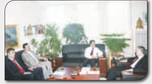
Ek Ödemede Aylık Mahsuplaşmayı Maliye Müsteşarı Ağbal'a da İlettik