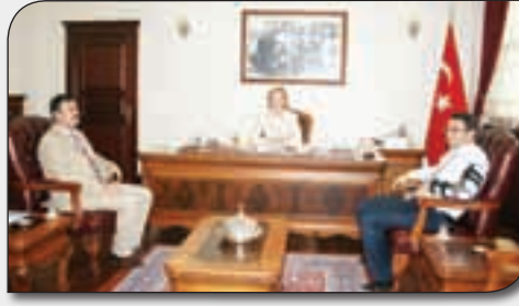
Devlet Bakanı Selma Aliye Kavaf'ı Ziyaret Ettik